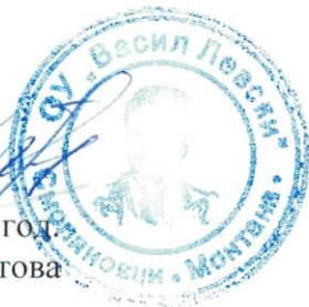
ГРАФИК за консултации на учителите през втория учебен срок на 2021 / 2022 година